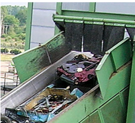
Option Réhausse de rives