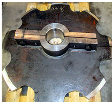
Option Tourteaux démontables